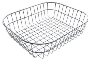
Cesta blanca de acero inoxidable