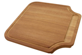
Tabla de corte de madera Iroko