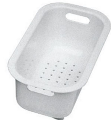
escurre pasta blanco