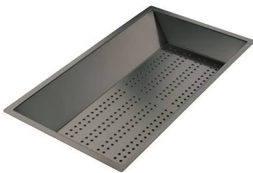
Bandeja perforada inox PVD Gun Metal