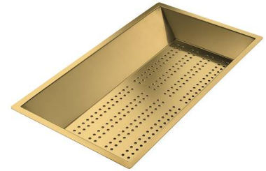
Bandeja perforada inox PVD Gold