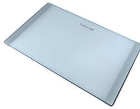
Tabla de corte de cristal

* sólo en combinación con el accesorio 8644 101